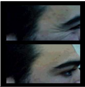
Resultado del botox./ M.P.